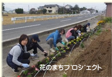
花のまちプロジェクト