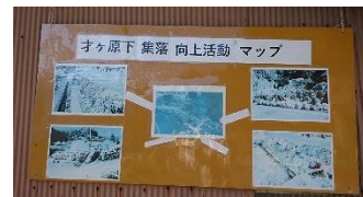
オケ原下集落(安来市)