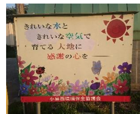
小島西環境保全協議会 (出雲市)