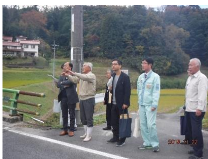
「大東師弟集落保全の会」との意見交換