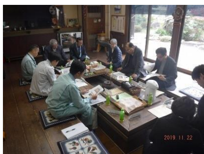
「上意東地域向上委員会」との意見交換

また、今年度も活動組織の皆様からのご意見をいただきながら、本交付金の取組がより良いものになるよう推進していきますので、引き続きよろしくお願いたします。