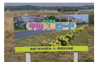
揖屋千拓地域農地・水・環境保全組織 (松江市)