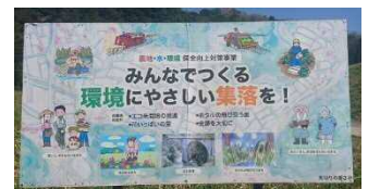
魚切りの郷さの (浜田市)