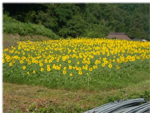
とても綺麗に咲きました☀

先日の、反省会、兼お花見会、兼今後の活動についての打合せ会では、「今度は大根を蒔こう、そばを蒔こう」と楽しく会話が弾んでいました。