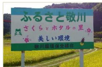
敬川環境組合(江津市)