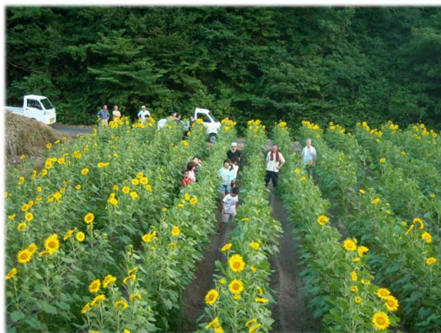
ひまわりと一緒にパチリ！

中でも集落の中心部にあった圃場は、以前は菊の栽培がされ、ハウスも建っていましたが、病気入院を機に管理する者がいなく、荒れた状態になっていました。